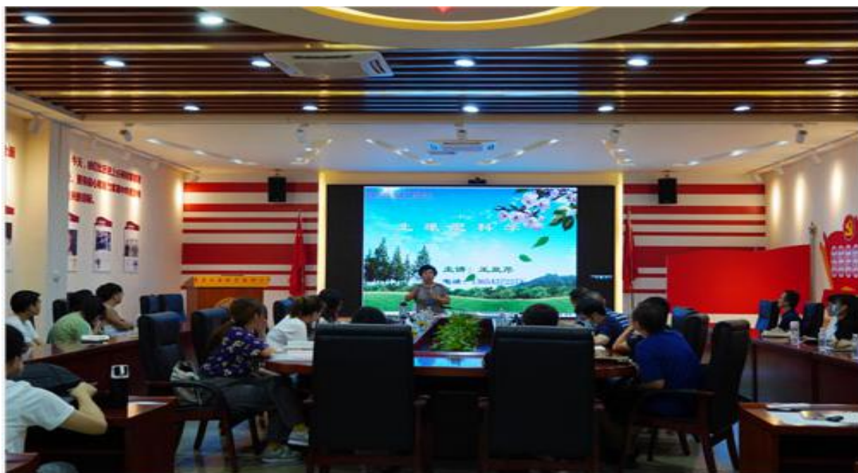
图为大旺校区讲座现场