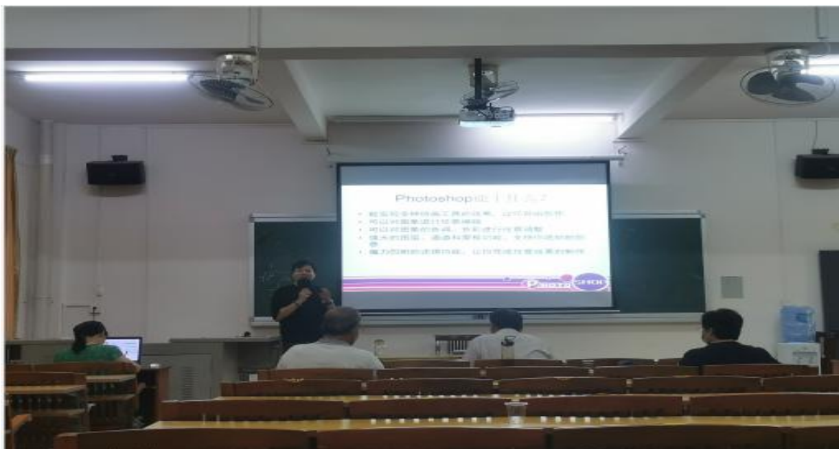
图为艺术学院本科授课教师试讲现场