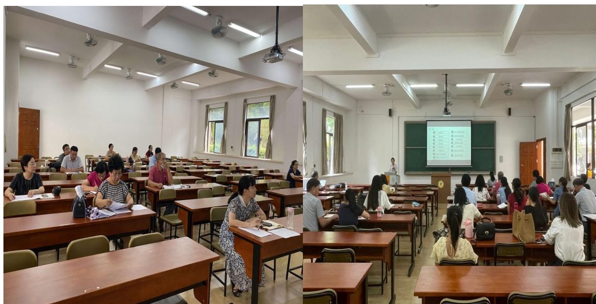
图为财经政法学院本科授课教师试讲现场