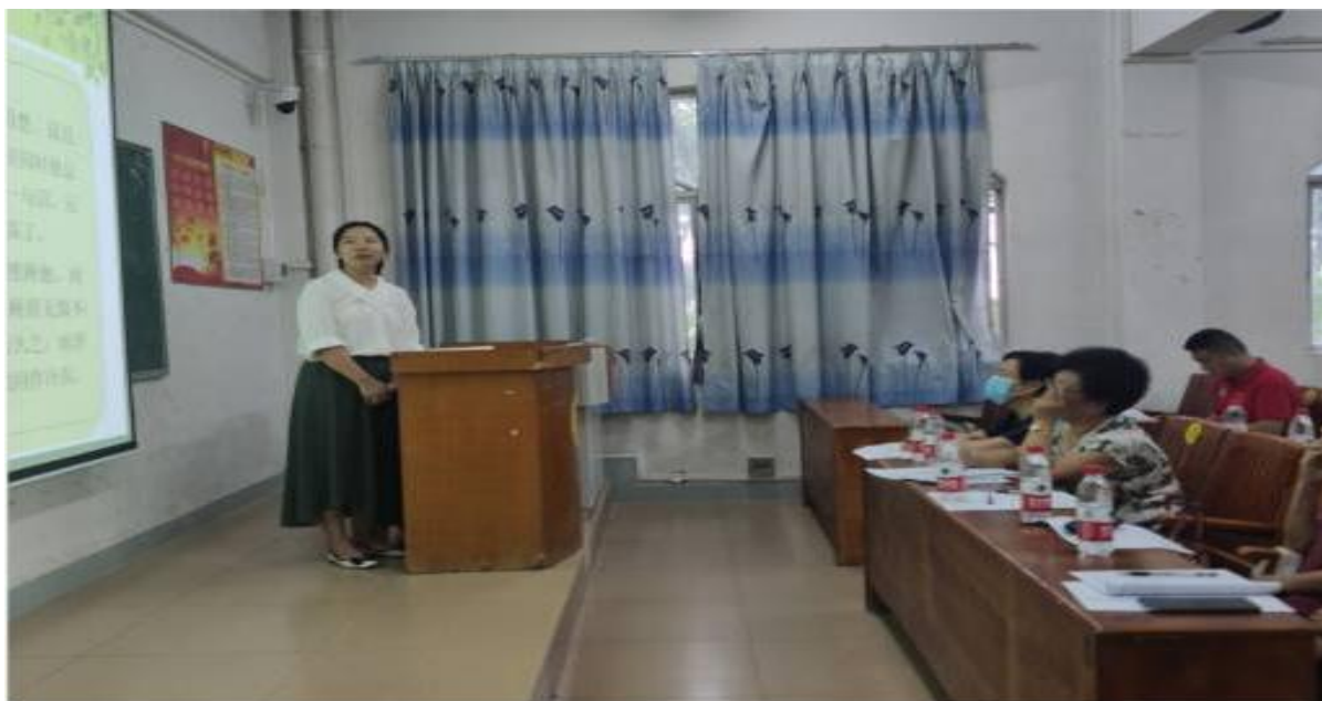
图为文化与传播学院本科授课教师试讲现场