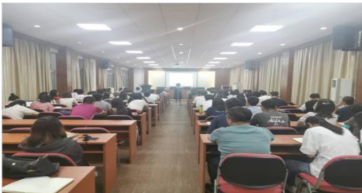
图为星湖校区讲座现场