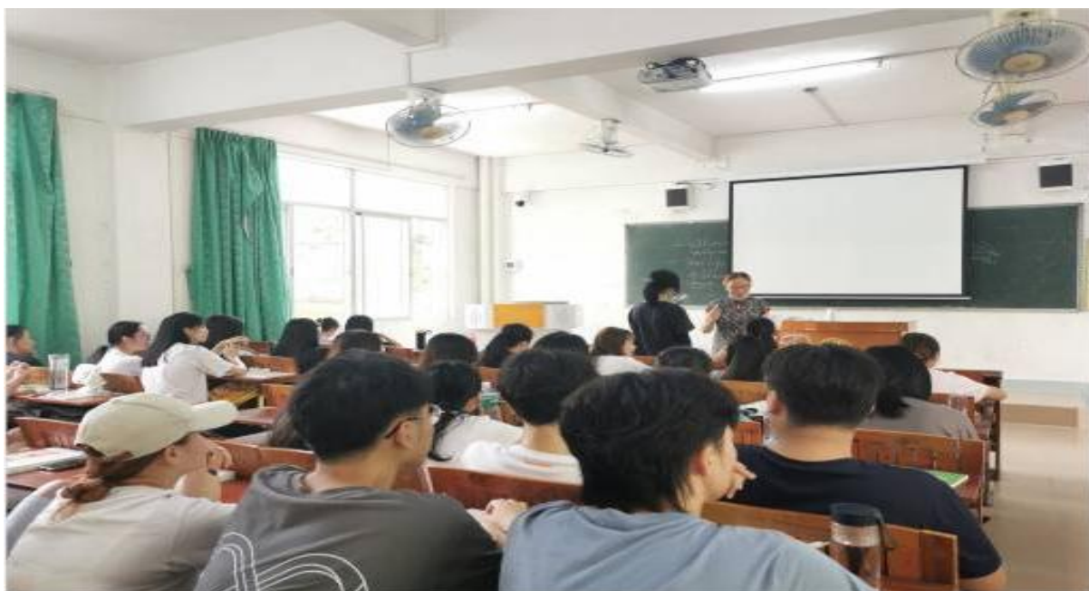
图为开学第一天课堂实况