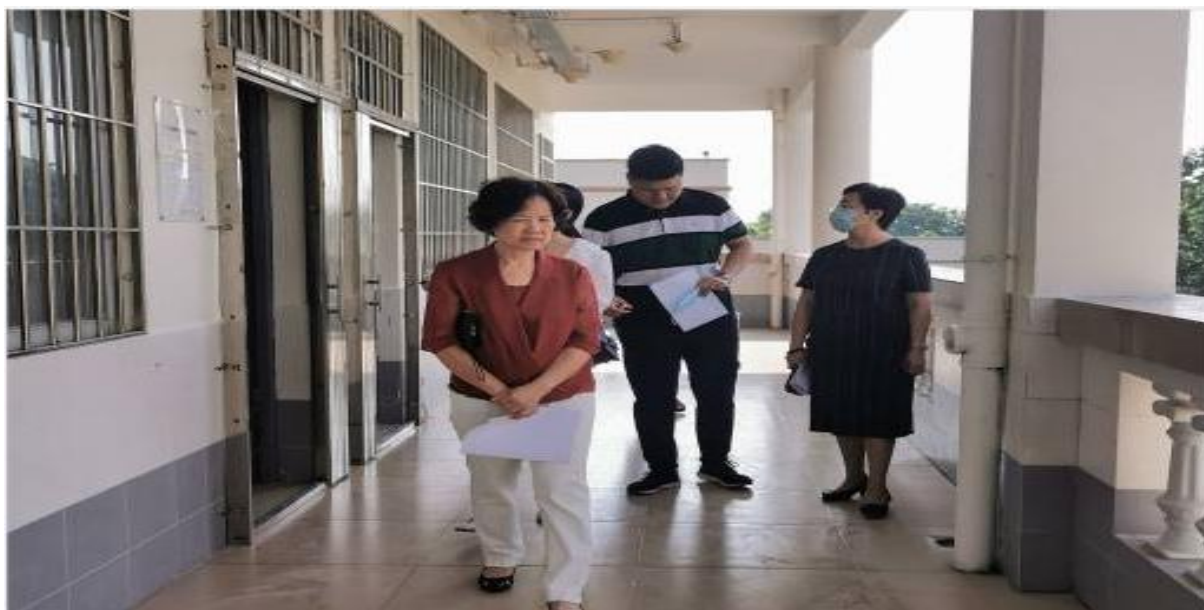
图为第二巡查组查看教学区学生上课情况

开学第一天第一节大课，两校区学生应到课人数6317人，实到课人数5812人，平均到课率为92.01%，班级到课率95%以上58个，占总上课班级的49.15%。