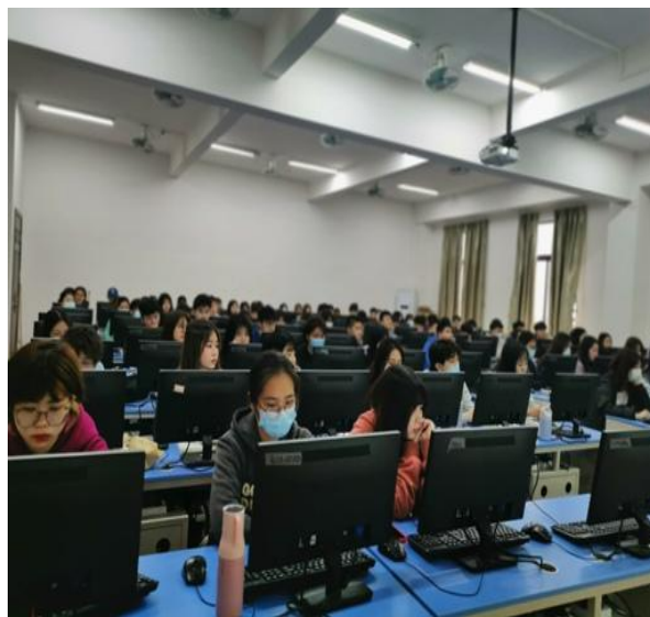
图为开学第一天课堂实况