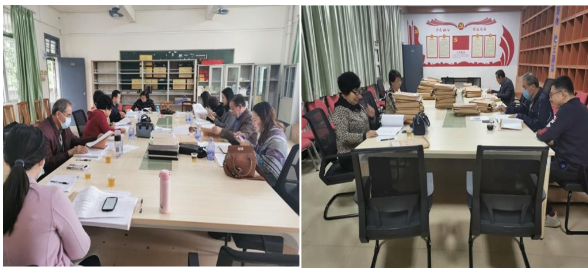
图为检查组人员复查本科试卷工作现场

从检查结果来看，各教学单位非常重视本科试卷档案管理工作，在试卷档案的收集、整理、建档、归档方面做了大量实际工作，取得了一定的工作成绩，但同时也发现本科试卷批阅与归档工作存在一些突出问题。希望全校各相关单位以本科课程试卷批阅与归档质量整改为契机，注重细节，现自我完善，自我提高，加强试卷及各项教学文档规范化意识，为我校本科学位评估相关工作做好充分准备。