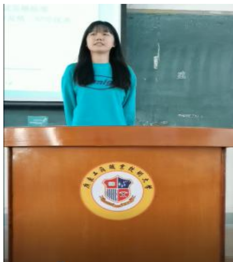
图为学生60秒自我介绍

第一次线下完成，每个人用自己认为最标准的普通话，做一段不少于60秒的自我介绍。这个作业的目的是了解学生的基础教育水平，了解学生的普通话状态，了解学生的基本文化素养，了解学生的表达能力和基本的与人交往的能力。也为普通话考试的第四题做一个铺垫。