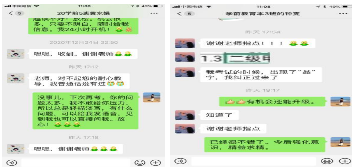
图为部分学生的微信留言

普通话的课程结束后，从学生的反馈信息看，同学们的学习热情不但没有因为课程的结束而减弱，反而因为成绩的及时出来而使得没有过级的同学更加紧张，也使得没有取得更好成绩的同学略有遗憾。从微信留言可以印证这一点。