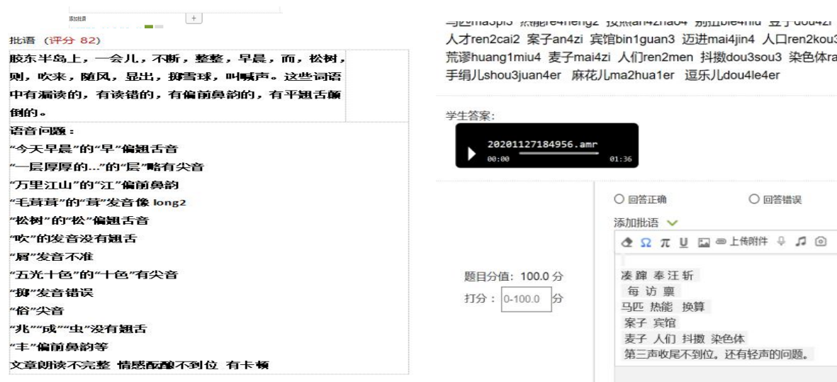
(图为教师与学生的批改选例)

每次作业完成后，教师进行全批全改，指出学生的语音问题，便于在学习的过程中进行有针对性地纠正。教师批改后及时进行反馈总结，效果良好。