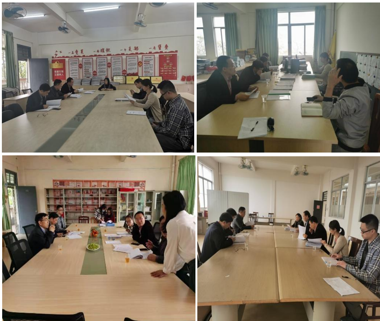
图为教学检查组工作现场

期初教学检查为学校例行工作，对加强学校的教学质量监控，稳定教学秩序，提高教学质量，促进优良的教风、学风起到了重要作用。