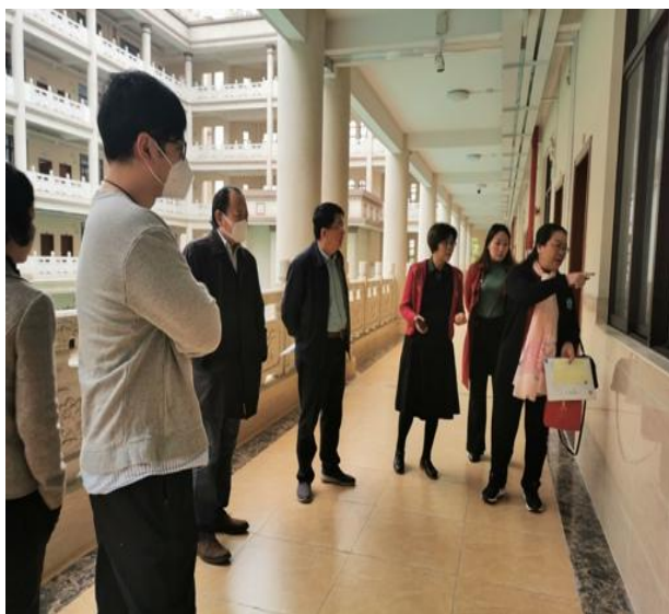
图为第三检查组成员巡查课堂情况

各检查组对各教学区上课情况给予了充分肯定，同时针对检查中发现的问题和不足提出了整改建议。